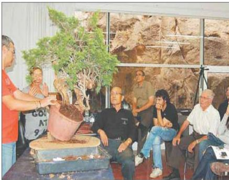
Darrera mostra de tardor de l'Associació Tarragona Bonsai, en una demostració d'una savina.

Per mostrar el treball realitzat als arbres i contagiar l'afició