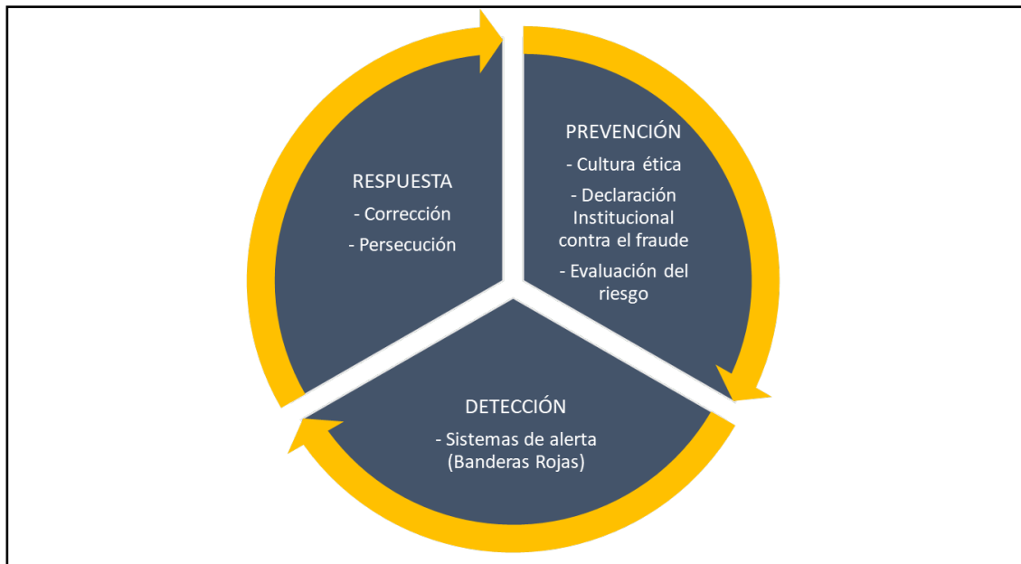
Gráfico 3. Ciclo antifraude