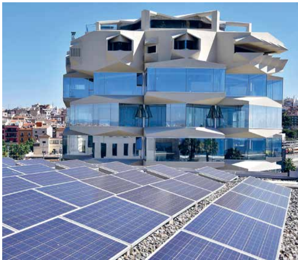
Ja s'han començat a fer proves tècniques per avançar cap a la futura comunitat energètica.

Per el salt cap a l'electrificació, però, requereix energia verda si es vol ser realment sostenible. Fa temps que l'Autoritat Portuària està fent instal·lacions de solar fotovoltaica a les teulades dels seus edificis per a autoabastir-se. No obstant això, si el conjunt de la comunitat portuària vol fer avenços en matèria d'electrificació, cal disposar de més molta més energia renovable. És per això que s'està impulsant una comunitat energètica a l'entorn portuari, que gestioni la creació i distribució d'electricitat verda i faciliti la transició energètica del conjunt d'actors portuaris.