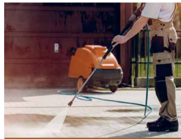
El seu equip humà és la base del servei que ofereixen.

Les certificacions que han rebut evidencien el compromís amb la feina ben feta en tots els àmbits on treballen: oficines, comunitats de veïns, centres educatius, restauració i hoteleria, centres mèdics i assistencials, comerços i indústries. De fet, alguns dels seus principals clients són concessionàries del Port de Tarragona. A. Ferran