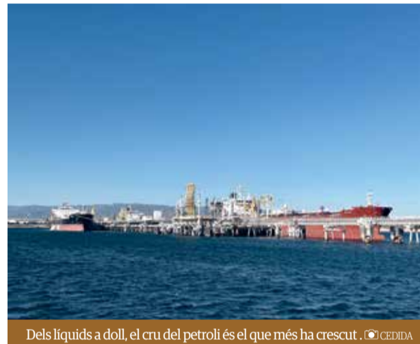
Dels líquids a doll, el cru del petroli és el que més ha crescut.

E l Port de Tarragona està vivint un 2023 excepcional en el moviment de mercaderies. Els seus tràfics estructurals, els líquids a doll i els agroalimentaris, acumulen mesos de creixements destacats. A més, altres tràfics vinculats a l'estratègia de diversificació estan registrant dades molt positives que han fet que Tarragona lideri el rànquing dels ports que més creixent de tot l'Estat. Així es desprèn del balanç d'octubre. El passat mes van passar pels molls tarragonins 2,97 milions de tones, cosa que suposa un augment del 47,6% respecte al mateix període de l'any anterior. Les bones dades converteixen octubre en el segon millor mes de l'any, només per darrere de febrer, quan es van moure 2,98 milions de tones.