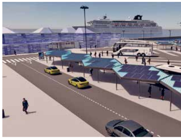
D'esquerra a dreta i de dalt a baix, l'esplanada de la terminal de Guadalajara; l'estació ferroviària de la Boella; les obres del vial inferior que permetran l'accés a la ZAL des de la carretera C-31 B i una imatge virtual de la futura terminal de creuers i el seu entorn urbanitzat.

corresponent. Actualment, s'està fent gestions amb Adif ultimant els detalls de la connexió ferroviària.