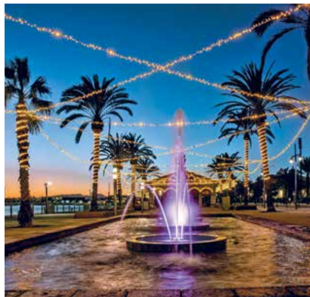
Tota la il·luminació nadalenca estarà alimentada amb energia verda.

L'encesa marca el tret de sortida. Més enllà de l'expectativa per a veure la il·luminació na-