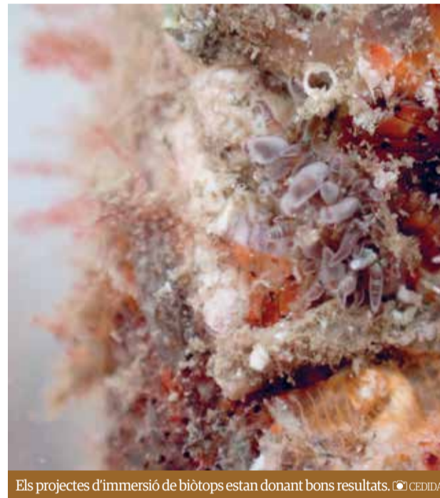
Els projectes d'immersió de biòtops estan donant bons resultats.