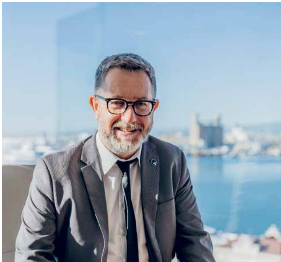
El president explica que es farà una implantació eòlica, amb tres aerogeneradors, al dic de Llevant.

—Hem fet un estudi per a avaluar la instal·lació de tres aerogeneradors al dic de Llevant. Les xifres indiquen que es podrà amortitzar la inversió en un temps raonable. Ara bé, en l'àmbit dels aerogeneradors hi ha un altre aspecte en el qual el Port està molt ben posicionat