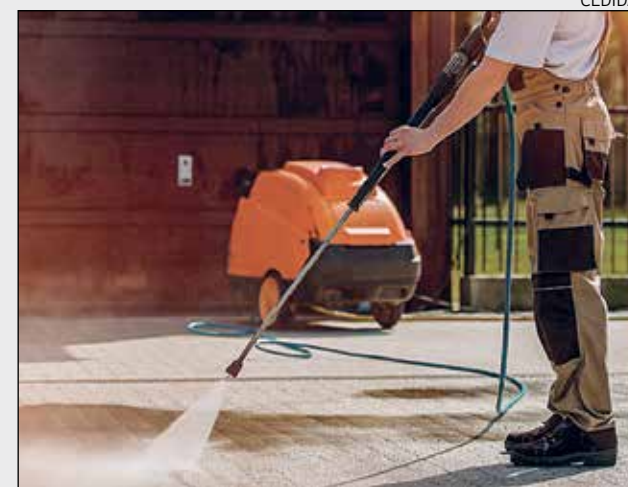
El seu equip humà és la base de tot el servei que ofereixen.

Les certificacions que han rebut evidencien el compromís amb la feina ben feta en tots els àmbits on treballen: oficines, comunitats de veïns, centres educatius, restauració i hoteleria, centres mèdics i assistencials, comerços i indústries. De fet, alguns dels seus principals clients són concessionàries del Port de Tarragona.