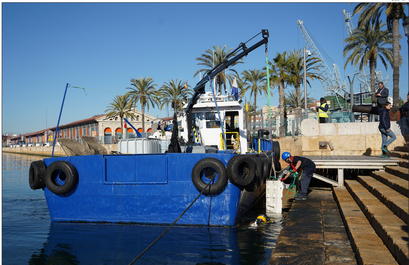
Immersió dels biòtops del projecte SEAREG a tocar de les Escales Reials, amb l'objectiu de regenerar la biodiversitat en aigües portuàries.

Aquesta filosofia de transformació cap a un ecosistema blau és justament una de les noves apostes en les quals el Port de Tarragona vol incidir. El Port s'està erigint com a promotor al territori de l'anomenada econo-