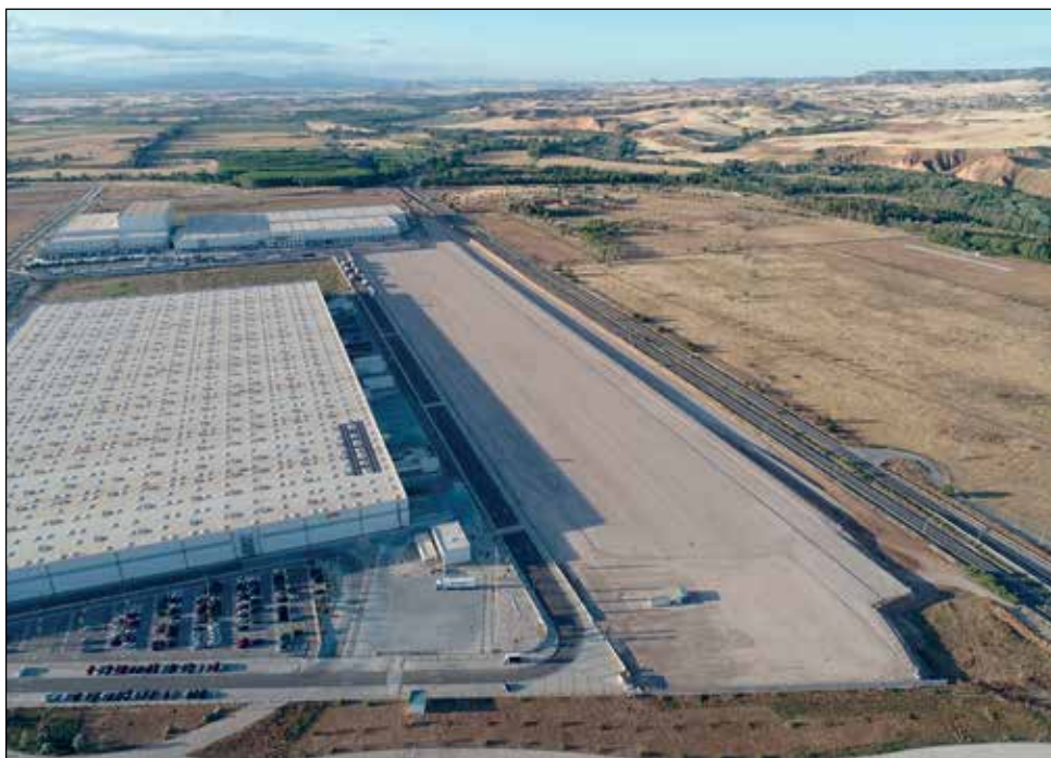
A dalt, el vial perimetral de la ZAL, finalitzat. A sota, l'esplanada del port sec de Guadalajara.

de del 45.000 m 2 als 130.000 i operar 8 trens d'entrada i 8 de sortida cada dia, amb destinació al centre de la península i a cap al nord d'Europa. L'entrada de CTC a la Boella es troba ara en un procés de concurrència i un cop aquest es resolgui s'oficialitzarà la concessió de part de l'exploració d'aquesta infraestructura ubicada dins del recinte portuari tarragoní.