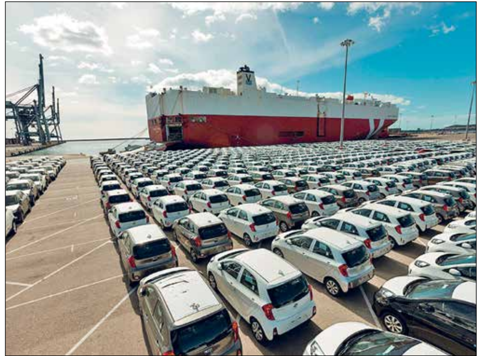
Ha augmentat gairebé un 40% el moviment de vehicles pels molls tarragonins.

El Port de Tarragona va registrar el millor mes de febrer dels darrers 20 anys pel que fa a tràfic marítim de mercaderies mogu-