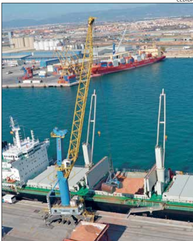
També s'està estudiant fer una reconversió d'una grua d'estiba.

El Port jugarà un rol important en aquesta nova etapa de la Vall, ja que esdevindrà un veritable laboratori de proves per a testar algunes de les innovacions tecnològiques en matèria d'hidrogen a les seves instal·lacions i equipaments. Així doncs, han acordat impulsar projectes pilot per a provar solucions tecnolò-