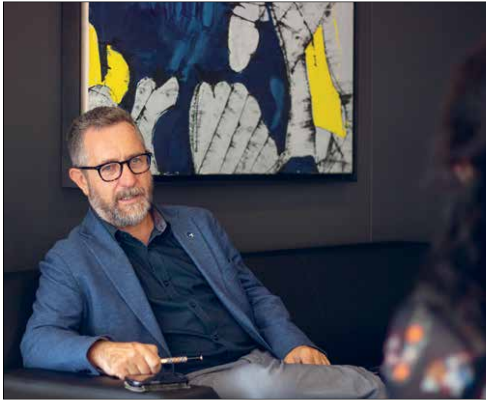
«A les portes obertes, volem mostrar qui som, d'on venim i cap a on anem», assegura el president.

—Els preocupa els efectes que pot tenir la Llei d'impostos sobre les emissions portuàries de grans bucs que vol impulsar la Generalitat?