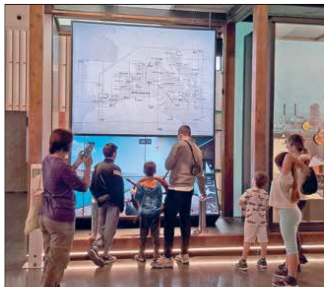
A dalt, una activitat de Tarraco Viva. A sota, una família al Museu.

15.000 persones han visitat el museu des de principis d'any, 5.000 dels quals visites individuals