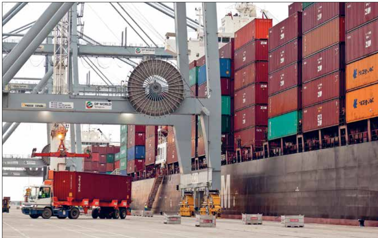
L'APT i l'actual operador, DP World, han fixat un pla d'acció fins a l'arribada del nou concessionari, per no afectar el servei.

Més enllà del no assoliment dels objectius de tràfics, els temps tenen molt a dir en la decisió que s'ha pres des del Port. I és que l'APT busca treure el màxim partit a l'oportunitat única que suposa la confluència de tot un seguit de peces clau en la seva estratègia de futur, com són la posada en marxa del port-sec de Guadalajara –amb una inversió de 30 milions d'euros–, la ZAL –on s'hi hauran invertit 30 milions més–, el Corredor Mediterrani