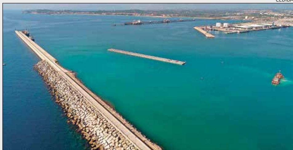
FCC Construcción ha executat infraestructures portuàries similars a Balears en 25 països.

FCC Construcción, companyia amb més de 120 anys d'experiència en obres portuàries, ha executat aquesta mena d'infraestructures en més de 25 països, potenciant l'economia i la mobilitat de totes les comunitats locals en les quals ha desenvolupat la seva activitat.