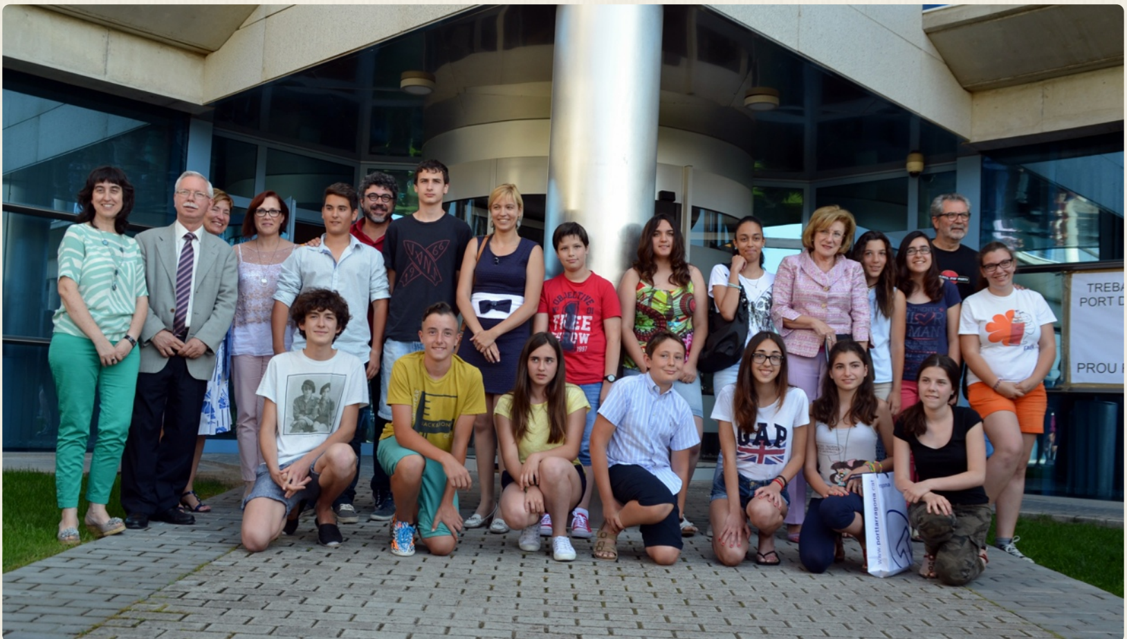
Foto dels guanyadors i seleccionats amb els membres del jurat, de l'APT i de la Generalitat - Ensenyament.