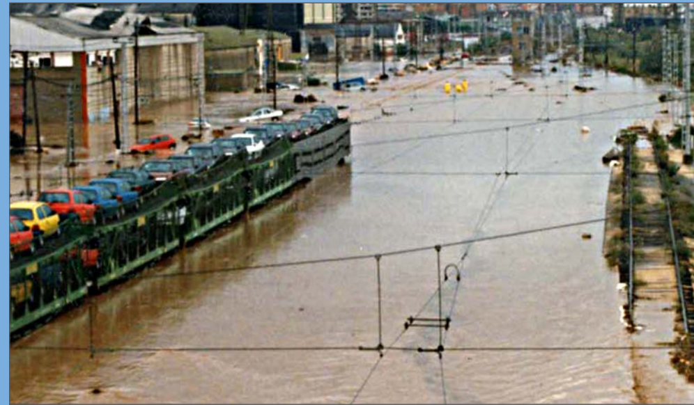
Vies completament negades al seu pas pel polígon Francolí.