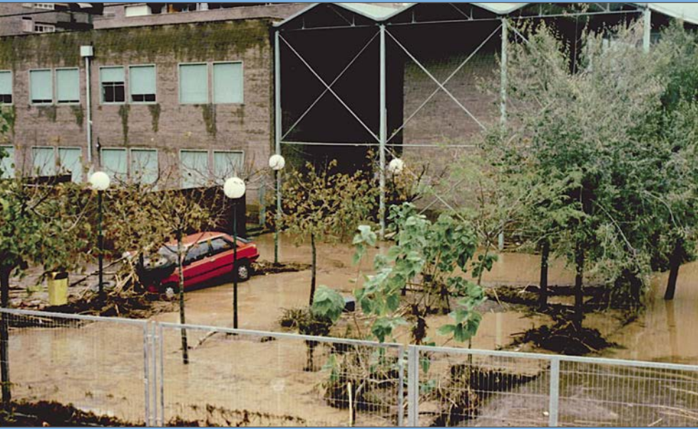
L'escola del Serrallo i el pati, vist des de les vies del tren.