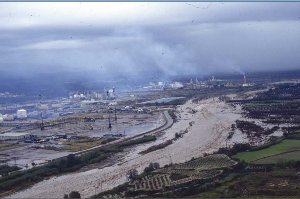
La força de l'aigua entra als camps i a les instal·lacions industrials del polígon nord.

Aquella nit i la matinada del dilluns 10 d'octubre les precipitacions no paren, van a més i es concentren especialment a la serralada prelitoral de la demarcació de Tarragona. A les muntanyes de Prades i a la serra del Montsant es recullen més de 400 litres per metre quadrat. Els primers efectes es comencen a notar a primera hora del matí quan encara és fosc: despreniments, vies locals intransitables i talls de subministrament elèctric en algunes localitats del Priorat i el Baix Camp.