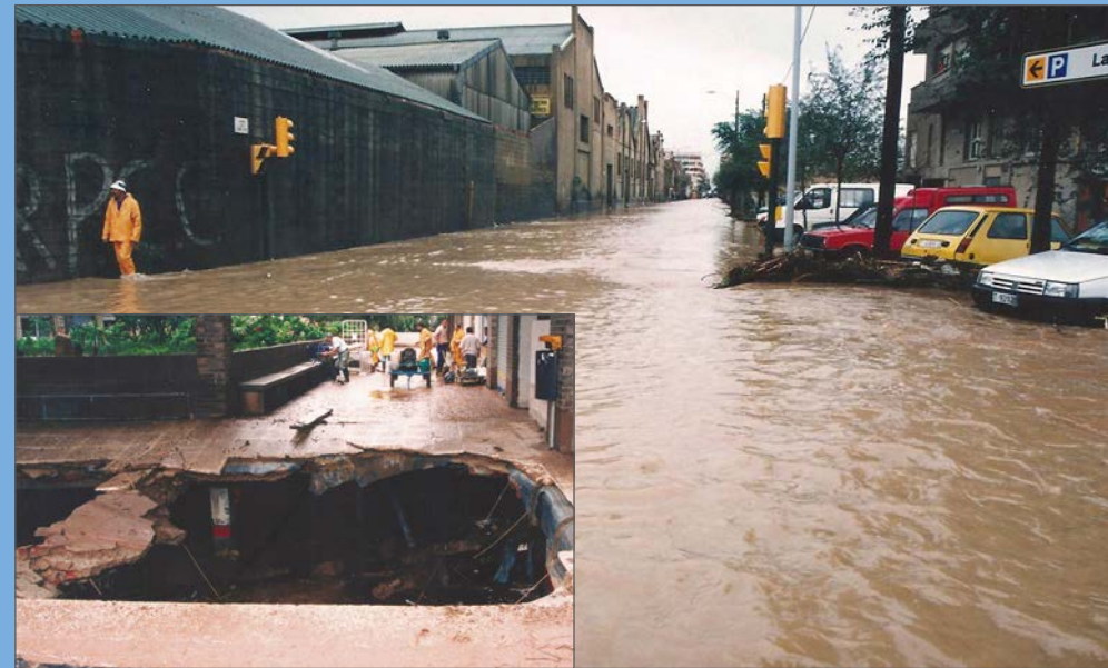
El carrer Torres Jordi amb les instal·lacions de la sofrera Pallarès a l'esquerra. En un requadre, l'esvoranc que es va obrir al pàrquing de Torres Jordi.

Al vespre, molts tornen al barri a recollir roba i documentació. Disposen de pocs minuts, però tots recorden la imatge de desolació, silenci i buidor. El retorn als pisos es farà de manera esglaonada al llarg dels dies següents.