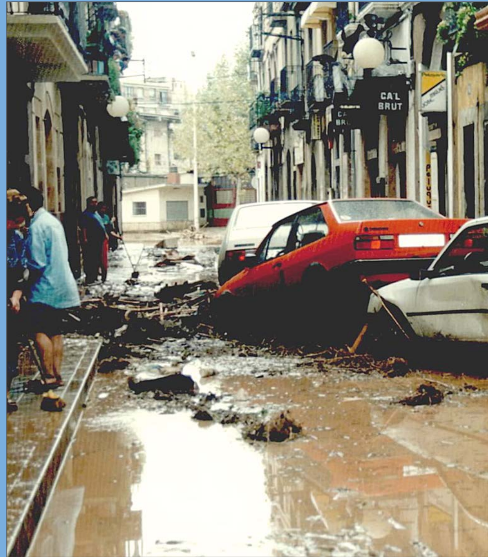
Vehicles amuntegats al carrer d'Espinach.

El barri queda aïllat. Els danys són quantiosos, també als petits magatzems on els pescadors guarden els seus estris. L'ordre d'evacuació arriba a quarts de dues del migdia, tot i que alguns veïns es resisteixen a sortir de casa. Al vespre, patrulles de la Guàrdia Urbana vigilen uns carrers buits i apagats. L'endemà comença l'operació neteja de fang i brutícia acumulada que s'allargarà uns quants dies. Les pèrdues materials en pisos i establiments comercials són molt considerables. El barri, molt brut, recupera ràpidament la normalitat fins al punt que al dia següent les barques surten a la mar.