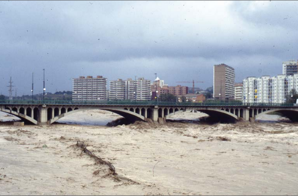
El Francolí al seu pas pel pont de l'avinguda Roma.

El 10 d'octubre de 1994, el riu Francolí es va desbordar i va inundar la part baixa de Tarragona, el polígon industrial i instal·lacions del port