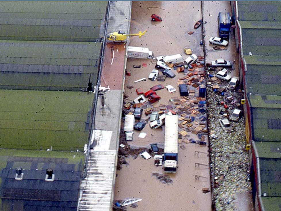
Vista aèria d'un dels carrers del polígon Francolí inundats.

Al cap d'un parell d'hores, apareixen màquines excavadores i llanxes zodiac i vehicles tot terreny dels bombers per a l'operació rescat. Les escales serveixen per accedir a les plantes altes i terrats de les naus i treure'n els empleats per portar-los al parc de bombers a Tarragona, a tocar de l'autovia de Salou. Fins i tot, s'hi utilitza un helicòpter. La inundació afecta gairebé totes les parcel·les del polígon i la represa de l'activitat industrial encara trigarà alguns dies.