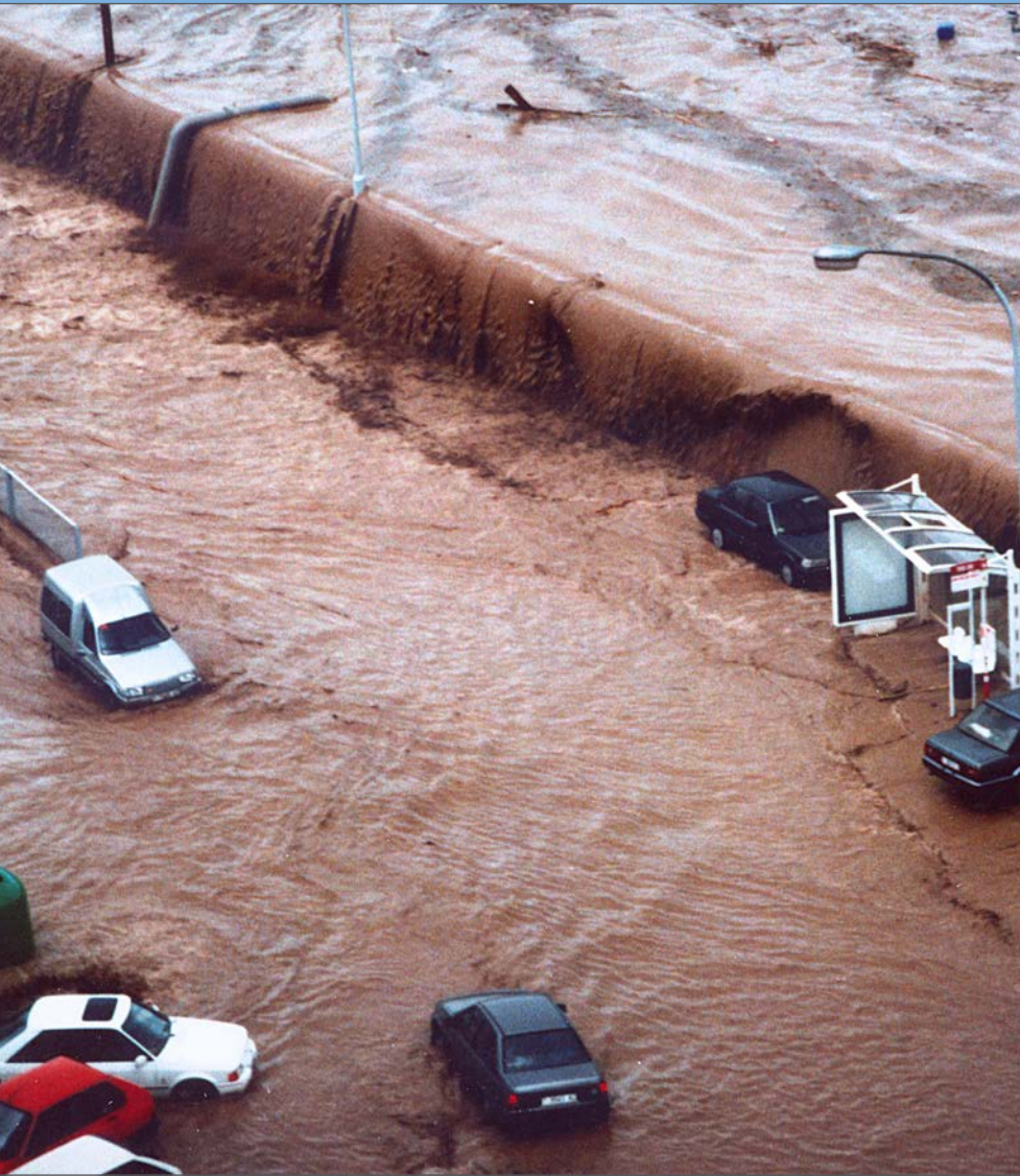
L'aigua desbocada salta el mur del passeig de la Independència en direcció a Torres Jordi.

Una onada procedent del riu entra a l'avinguda principal del polígon. En pocs minuts, l'aigua desbocada arrossega bidons, encasta vehicles contra parets i murs, i inunda carrers i naus. L'incident agafa per sorpresa la gran majoria de treballadors, enfeinats a quarts de 10 del matí d'un dilluns. Desenes d'empreses viuen una situació similar: baixos completament negats i treballadors refugiats als altells esperant que la crescuda de l'aigua baixi i algú els vagi a rescatar. Fora de les naus, cotxes arrossegats i amuntegats als carrers interiors del polígons.