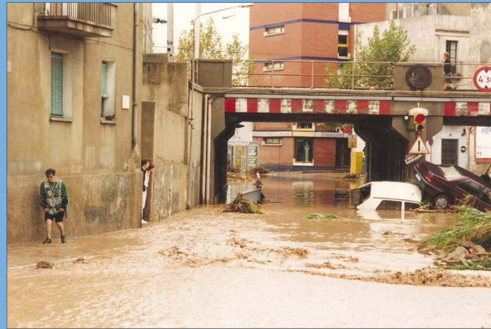
L'accés al Serrallo pel pont de la Petxina, inundat i amb vehicles encastats.

Diumenge 9 d'octubre de 1994: el Gimnàstic de Tarragona ha de jugar el seu partit número 500 a la Segona Divisió B. L'equip es desplaça a València per enfrontar-se amb el Llevant, però l'àrbitre es veu obligat a suspendre l'encontre per les intenses pluges. Un fort temporal de tardor afecta diverses zones del País Valencià i Catalunya.