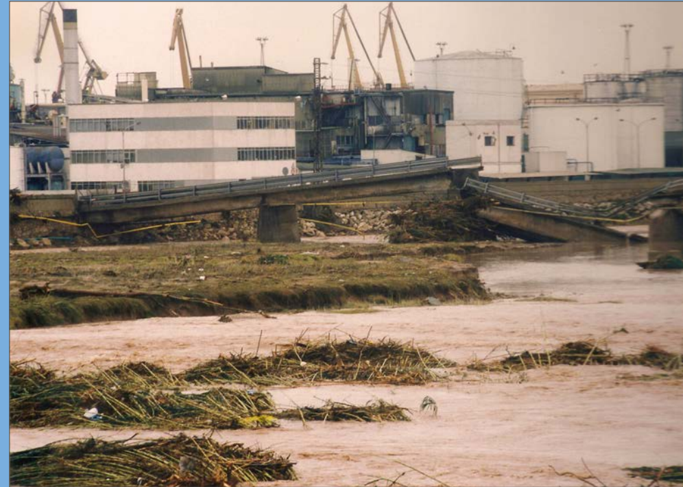
La força de l'aigua va trencar l'antic pont de Mafusa, dins les instal·lacions del Port.

El desbordament del Francolí paralitza aquell dilluns gran part de l'activitat portuària. Els danys són apreciables en diversos punts pròxims a la desembocadura. S'observen afectacions a l'Eix Transversal i al dic de tancament de l'esplanada, i es detecta el descalçament de pilastres i torres d'il·luminació, i l'arrossegament de canyes, branques i troncs.