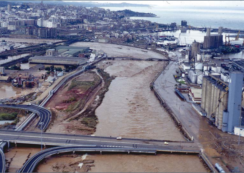
Vista general des de l'aire de la desembocadura del Francoí. En primer terme, l'Eix Transversal. Més enrere, el pont de Mafusa greument danyat.

El problema més greu es produeix al pont de l'Aliada o de Mafusa, que connecta el moll de Castella amb les empreses Mafusa, Fertasa i Kemira, situades al marge dret del riu, a tocar de la corba. El pont es trenca al migdia, els treballadors es queden aïllats i un parell d'hores després els bombers els avacuen en helicòpter. L'endemà, quan tornen a la feina, el paisatge també es desolador. Al port, l'activitat es recupera aviat als molls d'Inflamables, Catalunya i Aragó.