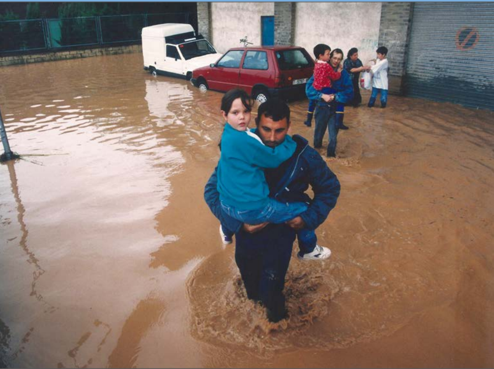
Veïns de Residencial Palau rescaten els nens de l'escola.

Els nens són distribuïts per diferents pisos de l'edifici. Mentrestant, contenidors de brossa, cotxes i motos naveguen sense control pels carrers dels voltants. Aquella estona es viu amb tensió perquè s'extén el rumor d'un possible esfondrament dels tres blocs de Torres Jordi. S'ha inundat completament el pàrquing soterrani i s'ha produït un esvoranc davant del local de l'associació de veïns del barri, dos fets que provoquen l'alarma generalitzada.