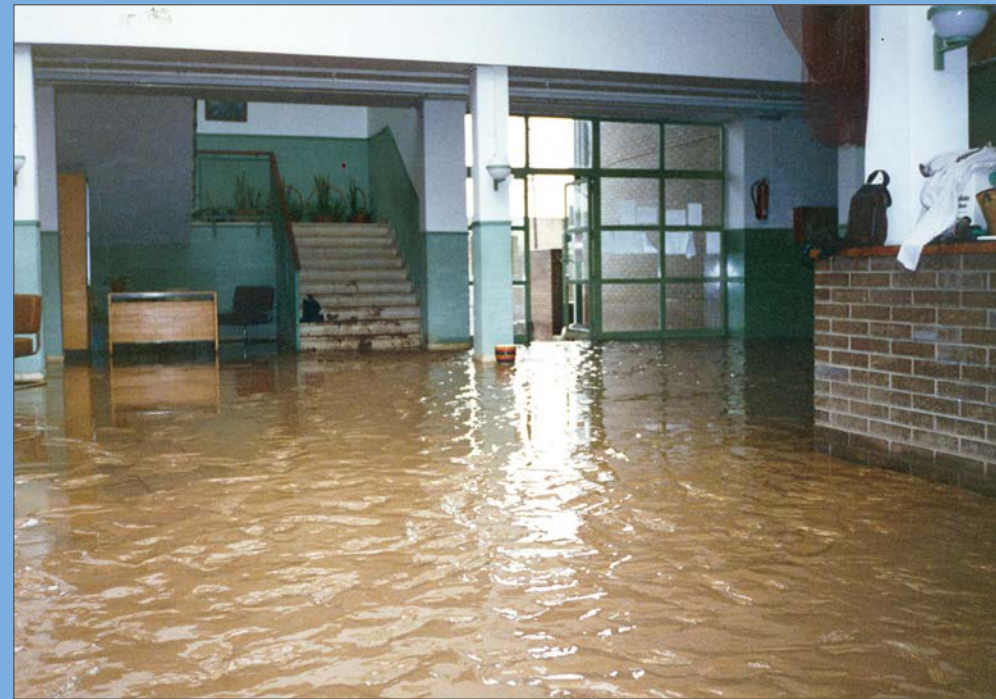
L'aigua inunda el vestíbul de l'escola del Serrallo.

Al migdia, autobusos de l'Empresa Municipal de Transports traslladen a professors i alumnes a dependències de la Guàrdia Urbana. L'endemà els mestres tornen al col·legi i comença l'operació neteja mentre el barri està pràcticament deshabitat, a l'espera de conèixer els resultats dels estudis tècnics sobre l'estat dels edificis. Després d'una setmana de vacances forçades, els alumnes tornen a les aules dilluns 17 d'octubre.